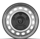
RINES DE ACERO DE 16"