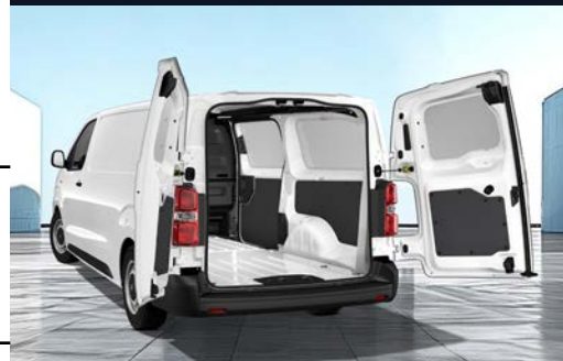
Capacidad de carga 1,400 Kg