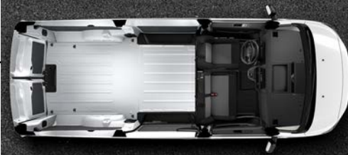
Volumen de carga 6.1 m 3