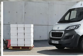
Capacidad de carga de hasta 1,850kg