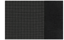
ASIENTOS EN TELA