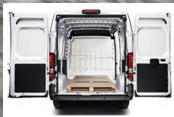
Capacidad volumétrica de hasta 15 m 3