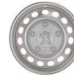
RINES DE ACERO DE 16"