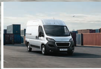
Motor Turbo Diésel