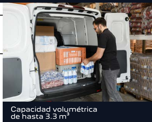
Capacidad volumétrica de hasta 3.3 m 3