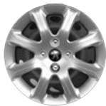
RINES DE ACERO DE 14"