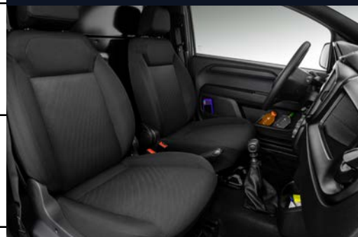
Pared fija divisoria entre cabina y área de carga