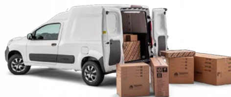
Capacidad de carga de hasta 650 kg