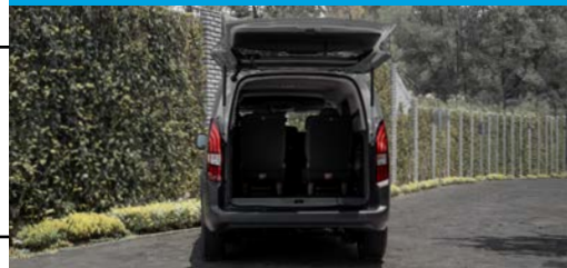
La más espaciosa del Segmento VOLUMEN DE HASTA 3,500L