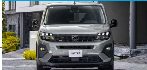
Eficiente motor diésel con RENDIMIENTO DE HASTA 20 KM/L