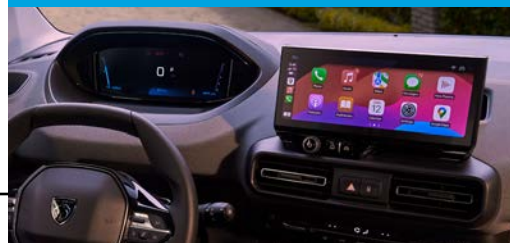
Nueva pantalla Táctil de 10" y Clúster Digital de 10"