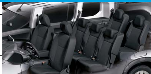
La minivan para 7 pasajeros