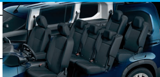
La minivan para 7 pasajeros