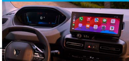
Nueva pantalla Táctil de 10" y Clúster Digital de 10"