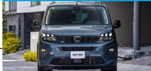
Eficiente motor gasolina con RENDIMIENTO DE HASTA 19.2 KM/L