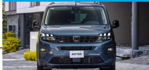
Eficiente motor diésel con RENDIMIENTO DE HASTA 20 KM/L