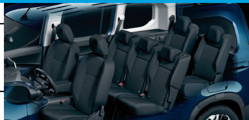
La minivan para 7 pasajeros