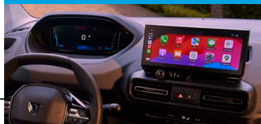
Nueva pantalla Táctil de 10" y Clúster Digital de 10"