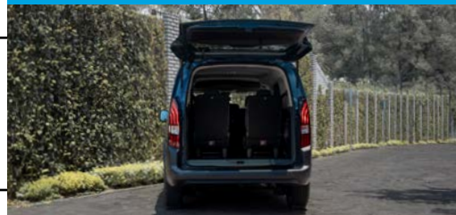
La más espaciosa del Segmento VOLUMEN DE HASTA 4,000L