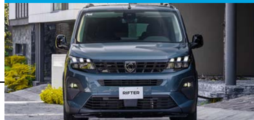
Eficiente motor gasolina con RENDIMIENTO DE HASTA 19.2 KM/L