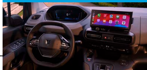
Nueva pantalla Táctil de 10" y Clúster Digital de 10"